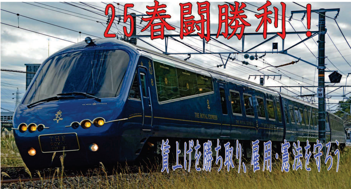
富士川駅にて撮影 (2024年12月9日 編集部)